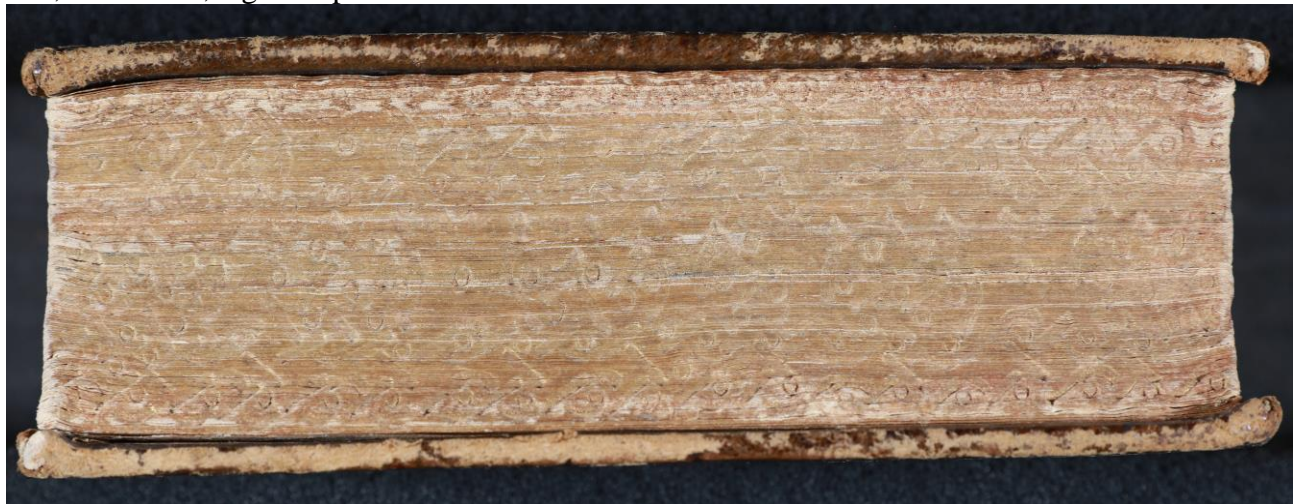
BUB, Raro A.44, taglio di piede.